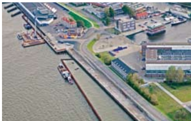
De Onderzeedienstkade, eind november 2007.

en daarna opvullen met schoon zand. Dit levert in totaal een vertraging op van zo'n vier maanden. Door het nemen van tijdelijke maatregelen (o.a. terreinverharding) is de 'nieuwe' kade echter wel beschikbaar tijdens de Tall Ships' Races in augustus 2008.