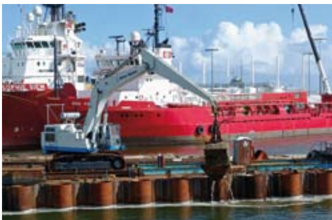
Opvullen van de damwandpalen met zand.

De renovatie van de Visserijkade (Multipurposekade) ligt nog goed op schema. Bij de werkzaamheden aan de Onderzeedienstkade is echter een kink in de kabel gekomen. De nieuwe kadewand bleek niet stabiel te zijn. De oplevering van deze kade staat nu gepland voor december 2008.