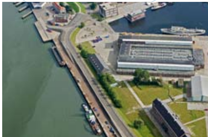
De Onderzeedienstkade, oude situatie.

Eind augustus ging de eerste damwandpaal de zeebodem in. Daarna volgde het opvullen van de stalen buispalen met zand. De sleephopperzuiger MNO Zeezand is begin oktober gestart met het opspuiten van zand, het zogeheten rainbownen, van de Onderzeedienstkade. In december 2007 werd echter duidelijk dat de stabiliteit van de damwand problemen opleverde. De nieuwe kadewand bleek op twee plaatsen over een lengte van zo'n vijftig meter te 'wijken'. Oorzaak is een zes meter dikke slappe kleilaag aan de buitenzijde van deze combiwand die op twee plaatsen te weinig druk geeft. Het profiel van een oude stroomgeul op deze locatie is de boosdoener. Oplossing van dit probleem is gevonden in het wegbaggeren van de kleilaag (medio maart/april 2008)